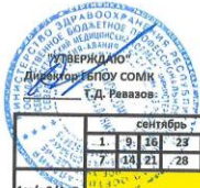
График учебного процесса на 2024-2025 уч.год (новый стандарт)